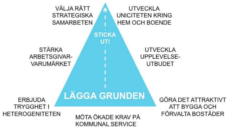
Figur 5. Omvärldsutmaningar för Älmhult sorterade efter i vilken mån de handlar om det som lägger grund för kommunens attraktivitet, eller om det handlar om att sticka ut jämfört med andra.

Detta kräver dock fokusering och profilering , samt en förmåga att nå ut med ett tydligt budskap. Det kräver också en gemensam vilja och målbild, samt ett förhållningssätt där man har mod att förändra och utveckla verksamheterna utifrån nya behov.